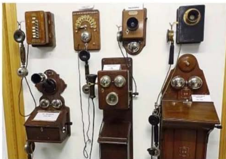
Fernmeldemuseum Mühlhausen: historische Telefone des 19. Jahrhunderts: mittig: das Bell'sche Telefon aus dem Jahr 1885.