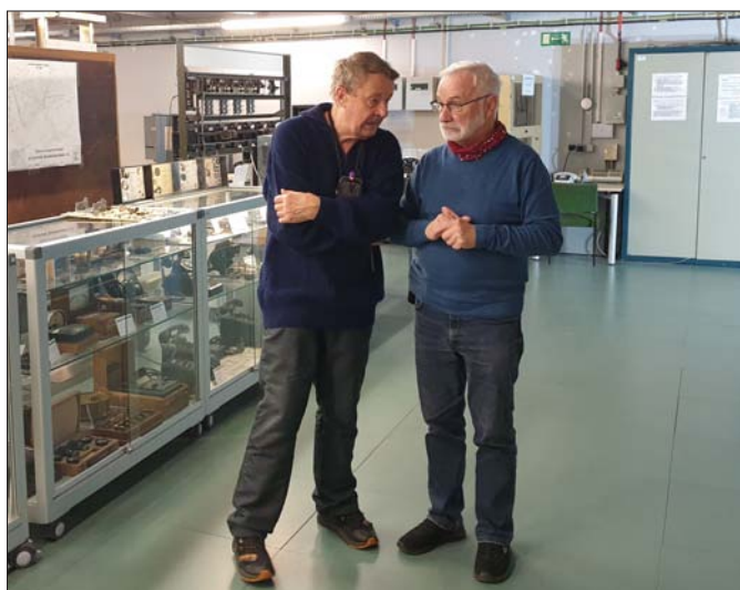
Fachsimpeln beim Rundgang im Museum