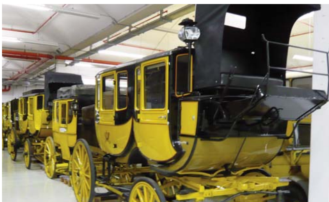
Ein riesiger Fuhrpark der Post, Postkutschen aus den Anfangsjahren, technische Anlagen aus allen Zeiten der Studio- u. Fernmeldetechnik

Was wir hier in den Lagerhallen des ehemaligen Zeugamtes zu sehen bekamen, war für uns alle ein einmaliges Erlebnis !