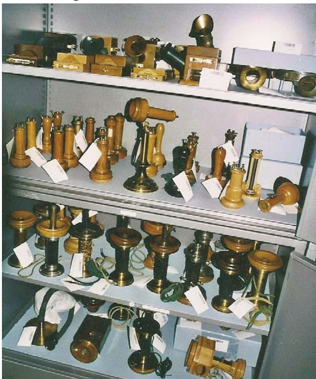
Telephone nach Philipp Reis und Graham Bell und die ersten Siemensapparate, gut verschlossen in Stahlschränken. Diverse Telegraphen und Morseapparate mit schön polierten Messingbeschlägen.