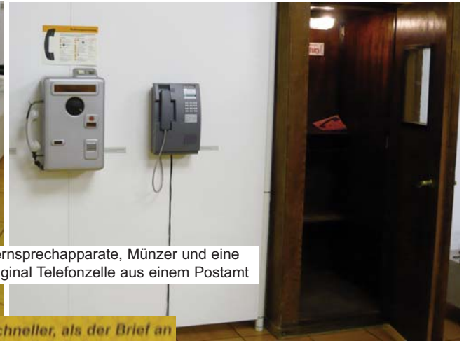
Fernsprechapparate, Münzer und eine original Telefonzelle aus einem Postamt

„Das Gemüt ändert sich oft schneller, als der Brief an Ort und Stelle kommt.“ (Friedrich Schiller)